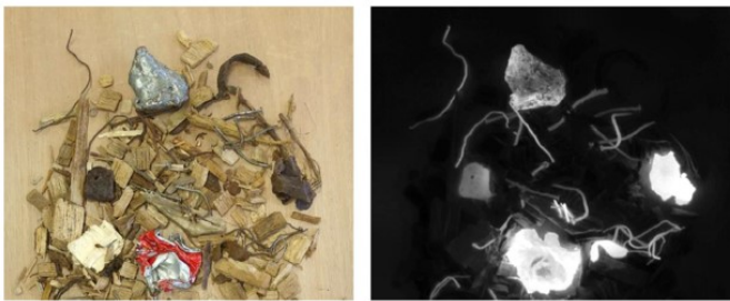
Bsp: VIS und IR Bilder weisen orthogonale Informationen auf

Im Verlaufe des Forschungsprojektes entsteht zusätzlich ein Demonstrator mit multimodalem Sensorsystem um neuartige multimodale Datensätze aufzunehmen und die Klassifikationsleistung von erwähnten Netzarchitekturen auch unter realen Bedingungen zu testen.